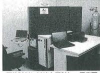
固体燃料にX線を照射し、検体表面から出される光電子を分析する「光電子分光装置」