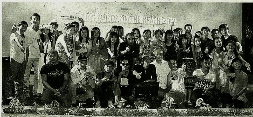
社員旅行はビーチで盛り上がった