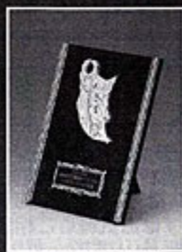
名古屋市工業研究所長賞